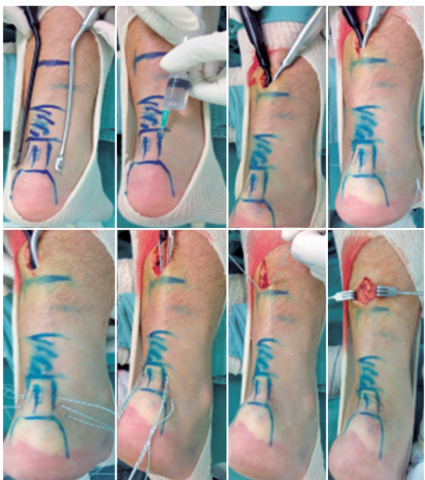
Figura 2 | Técnica cirúrgica do reparo percutâneo do tendão calcâneo pela técnica de Dresden modificada.

secção, entre a fáscia superficial posterior e o paratendão, garantindo que a sutura que fosse realizada ficasse dentro da bainha e não provocasse lesão do nervo sural, que é subcutâneo. O instrumento de Dresden (Figura 3) foi introduzido tangenciando o tendão calcâneo pela sua borda medial até 1cm da tuberosidade do calcâneo.