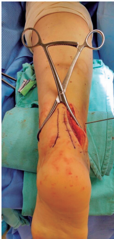
Figura 1. Posição de pronação e acesso posterolateral, no momento da redução da sindesmose.