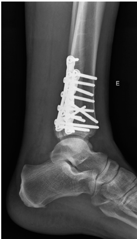
Figura 4. Radiografia pós-operatória, fixação do maléolo posterior por acesso posterolateral. Este paciente também recebeu um acesso posteromedial para tratamento de componente medial do maléolo posterior.

mais de dificuldade, a abordagem de uma fratura simples do maléolo medial, ou de uma lesão do complexo deltoideo. Finaliza-se realizando a sutura ou por planos, com atenção ao fechamento da fásia muscular fibular. O curativo é seguido por imobilização pós-operatória com órtese suropodálica. O paciente é mantido sem carga, mas com mobilização precoce até a terceira semana. Nessa, a carga parcial progressiva com a bota é iniciada. A fisioterapia motora é realizada desde a primeira semana até o quinto mês após a cirurgia.