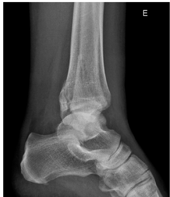
Figura 3. Radiografias pré-operatórias de fratura de tornozelo.