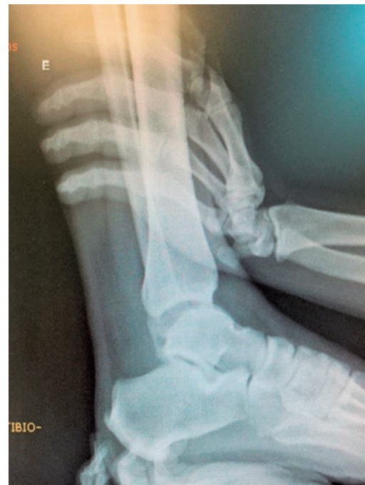
Figura 2. Gaveta anterior/subluxação anterior