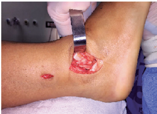
Figura 3. Abordagem.

Em seguida é realizada uma abordagem lateral minimamente invasiva (Figura 3), levemente curva no tornozelo sobre a extremidade distal da fíbula com cerca de 3-4cm, dissecação e localização do local de inserção do ligamento talofibular anterior (LTFA) no tálus, e do local de inserção do ligamento fibulocalcâneo (LFC) no Calcâneo. Depois confecciona-se os quatro tuneis ósseos, um no tálus exatamente no sítio de inserção do LTFA, dois na fíbula em formato de "V" invertido e um no calcâneo na inserção do LFC (Figura 4). Utilizamos broca de 4.8mm ou 4.5mm nos