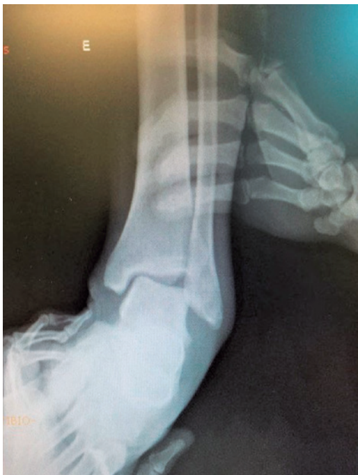
Figura 1. Estresse em varo.

Os critérios de exclusão foram pacientes que não quiseram participar da pesquisa, pacientes nos quais não foi realizado escore AOFAS no pré-operatório, e 1 ano de pós-operatório. Pacientes nos quais não foram realizadas as radiografias em AP do tornozelo com estresse em varo, e perfil do tornozelo com gaveta anterior, no pré-operatório e 1 ano de pós-operatório. Pacientes que perderam o seguimento. Pacientes com artrose. Pacientes com lesões associadas e pé cavo.