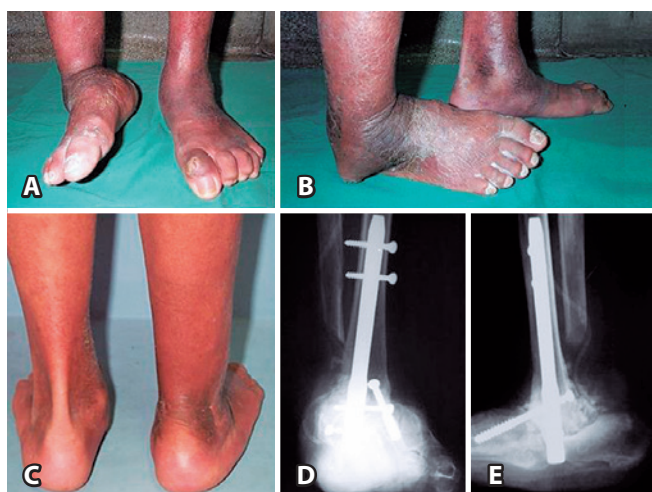
Figura 5. Fotografias mostrando acentuada deformidade em varo e grave instabilidade do tornozelo, provocando apoio na borda lateral do pé direito (5A), e formação de úlcera de pressão sob o máléolo fibular (5B). Vista posterior dos membros inferiores (5C) mostrando o adequado alinhamento após artrodeze tibiotalocalcanear. As imagens radiográficas mostram a correção obtida (5D e 5E).

No momento da avaliação, após empregar nosso protocolo sistematizado de tratamento, obtivemos resultado satisfatório da ACN do tipo IV em 31 das 63 extremidades (49%), e insatisfatório nas demais 32 extremidades (51%). Dentre os resultados considerados satisfatórios, 21 das 31 das extremidades (68%) obtiveram resultado classificado como bom, enquanto que em 10 extremidades (32%) o resultado foi considerado apenas aceitável.