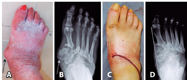
Figura 1. Proeminência localizada na face medial do pé direito (seta pontilhada escura) (1A) correspondendo à saliência óssea das cunhas medial e intermédia, identificadas na imagem radiográfica do pé (seta pontilhada clara) (1B). Após ressecção cirúrgica verifica-se melhora no contorno do pé (1C), com correspondente eliminação da proeminência óssea (linha tracejada clara) (1D).

As modalidades de tratamento cirúrgico empregadas foram as seguintes: 1) exostectomia simples (Figura 1); empregada para remover saliências ósseas localizadas em áreas de apoio sujeitas à pressão, indicada desde que o pé e/ou tornozelo estejam estáveis após o término da fase de consolidação óssea; 2) cirurgia óssea reconstitutiva (Figura 2); empregada para realinhar ossos e articulações gravemente deformados e/ou instáveis, indicada nas extremidades cuja circulação é adequada e desde que não haja