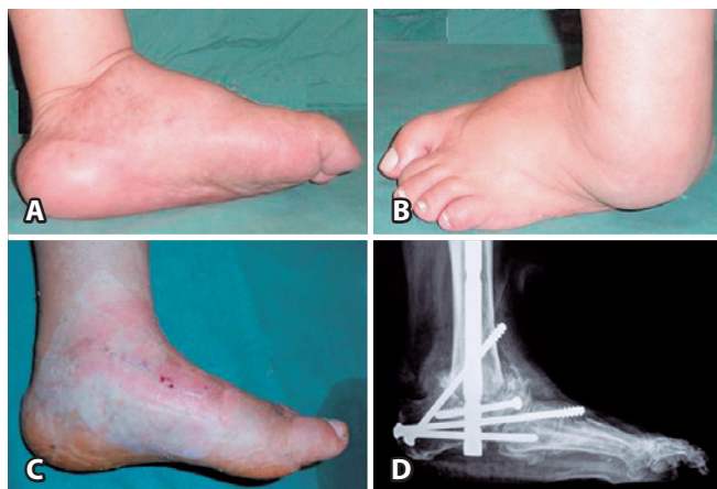
Figura 2. Imagem fotográfica nas projeções medial (2A) e lateral (2B) do pé e tornozelo esquerdo mostrando deformidade angular em varo. A correção do alinhamento do pé em relação ao eixo da perna (2C) após a cirurgia reconstrutiva que consistiu na panartrodese (2D).