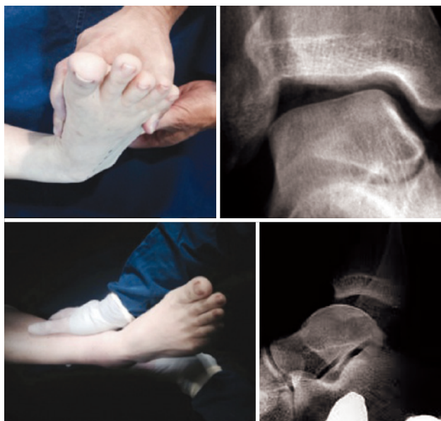
Figuras 1 y 2. Test de tilt talar y cajón anterior positivos

Se puede encontrar dos formas de inestabilidad: mecánica, la cual hace referencia a las anomalías anatómicas, secundarias a trauma o hiperlaxitud ligamentaria. En estos casos el hallazgo durante el examen físico corresponde a una prueba de cajón anterior y una prueba de bostezo lateral positivas (Figuras 1, 2),