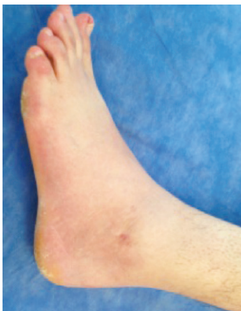
Figura 5. Pos operatorio 5 semanas

A partir de la 6a semana se indica terapia física para ganancia de arcos de movilidad, propiocepción, equilibrio, fortalecimiento de evertores y marcha con apoyo completo.